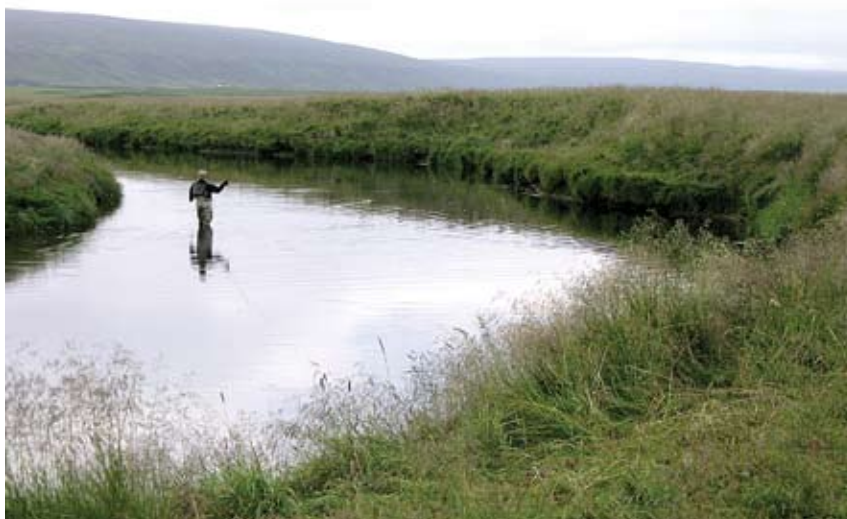
Frá Reykjadalssá í Reykjadal

Veiðimaður er orðinn vonlítill um að nokkuð sé að hafa. Hann skiptir um flugu og taum, setur undir lítið loðið héraeyra og ákveður að renna fyrir silung. Hann kastar á nokkra vel valda staði en án árangurs. Það er komið að kvöldi, hann ákveður síðasta kastið og hugsar til þess hve notalegt verði að koma í veiðihúsið og og fá sér hressingu eftir volk dagsins og aflaleysi. Og þá gerist undrið. Tekið er hraustlega í línuna og um leið hvín í hjólinu. Lax sýnir sig með því að stökkva nokkrum sinnum og nú hefst bar-