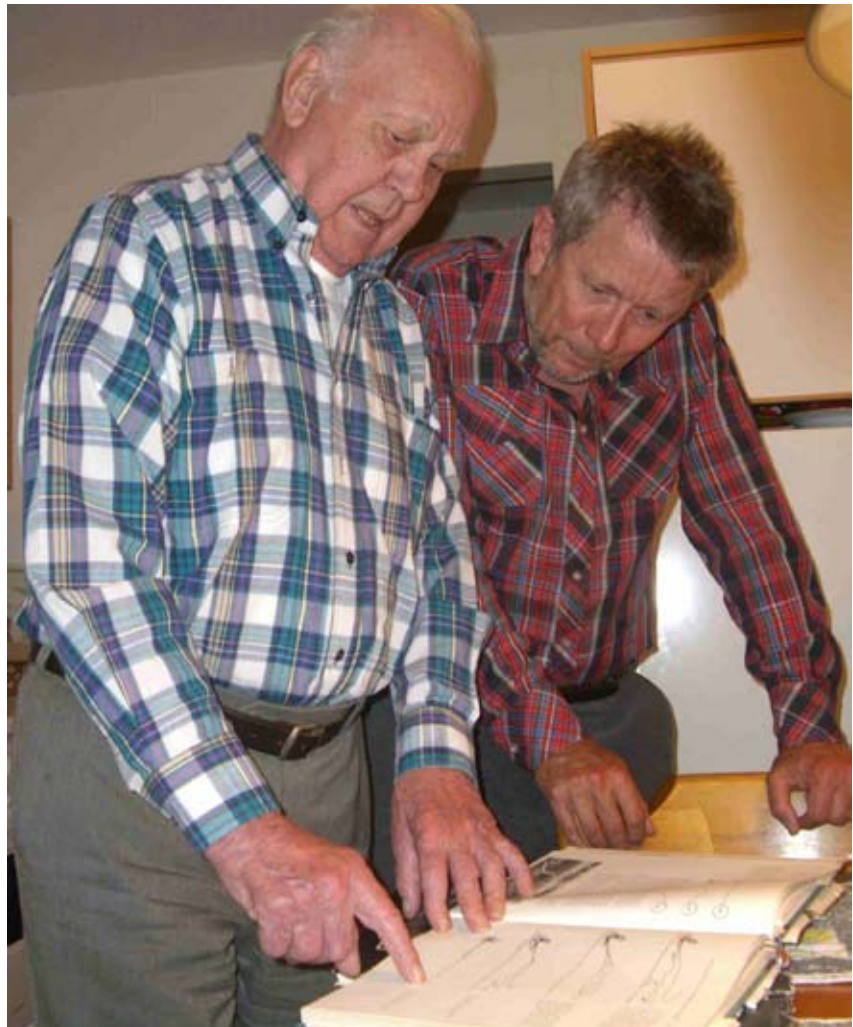
Kennslustund í eðlisfræði kastsins

Umbrot: Dagur Jónsson. Prentun: Frum ehf. www.armenn.is / armenn@armenn.is