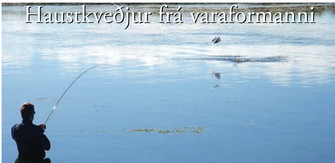
Vantsdalsá, lax á við Víðihólma.

Þá er komið að lokum vertíðar þetta árið. Einhverjir eiga þó eftir sjóbirtingsferð og bjóða þannig haustlægðunum birginn. Vonandi hefur vertíðin verið ánægjuleg fyrir alla og gefið af sér hæfilega veiði. Sjálfur verð ég að viðurkenna að ég kom fisklaus heim úr þó nokkrum ferðum þetta árið. Þrátt fyrir það hef ég átt margar stórgóðar laxfiskamáltíðir og á hæfilegar birgðir í litla frystiskápnunum mínum. Þrátt fyrir á stundum dræma veiði hafa ferðirnar án undantekninga verið ákaflega ánægjulegar og koma þar til einstök náttúrufegurð, fágæt veðurblíða og ekki síst sérstaklega góðir veiðifélagar.