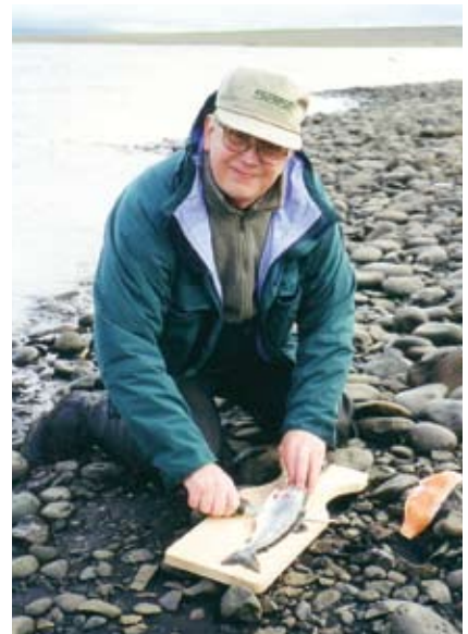
Ármaður #40 fer vel með feng á Vestra-Brandanesi við Húnavatn.

Ég mæli reyndar með því að menn séu með skotlínu eða skothaus við þessar aðstæður, því það er þreytandi til lengdar að kasta venjulegri línu upp í vindinn.