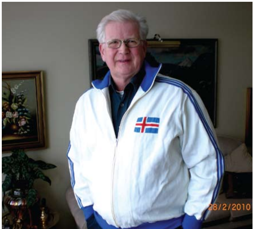
Treyja landsliðsins í fluguköstum þegar Íslendingar áttu menn sem kunnu þá íprótt árið 1972.

Ármenn þurfa ekkert að skammast sín fyrir veiðináttúruna, og furðulegt ef hún er komin út í það að horfa bara á fuglana og fjöllin. Ég held að Ármenn séu sem betur fer lifandi, og muni það bara að fara vel með feng og veiðifélagana. Maður verður