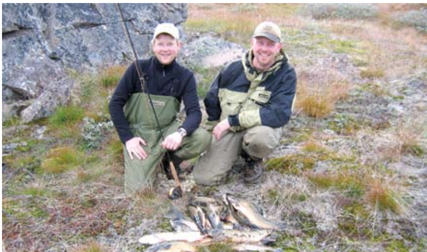
Ármenn nr. 382 og 705 deila veiðigeði með félögum sínum á Grænlandi haustið 2006.

Hér áður, þegar við bræður vorum að alast upp þá var pabbi af lífi og sál í félaginu og við fylgdum honum eins og hvolpar, hvort sem það var í veiðitúrum, hnýtingum á Skemmuveginum, hér í Árósum eða í einhverju öðru félagslífi. Svo fær hann kransæðaprengingar 1989 og fleiri hjartatengda sjúkdóma í kjölfarið og dettur meira og minna út úr starfi Ármanna og þá duttum við bræðurnir út líka.