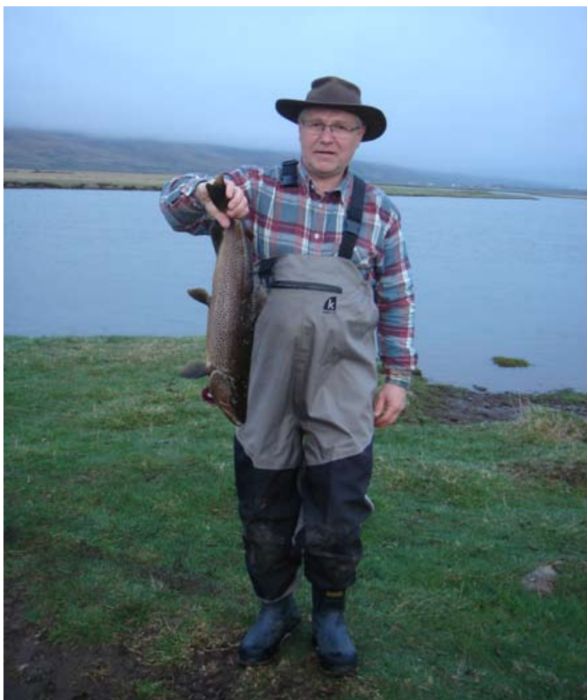
Ármaður nr. 739 nýtur veru sinnar við