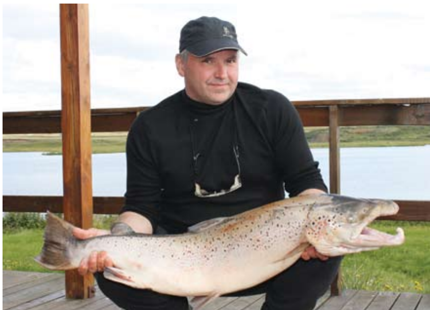
Formaður húsnefndar ætlaði á bleikjuveiðar í Soginu en fékk þennan.

Húsið er töluvert leigt út en þá er Ármaður yfirleitt í ábyrgð. Við viljum engin unglingspartí í húsinu því þarna eru munir sem eru algerlega ómetanlegir. En ef félagsnúmer er á bakvið er allt í lagi og það er sjálfsagt að fólk