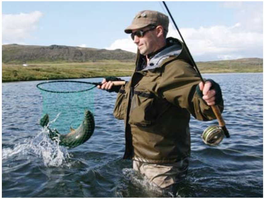
Ármaður #594 nýtur veru sinnar við veiðivatn.

Ég er ánægður með það sem búið er að gera og það sem framundan er. Ég er aðallega að pæla í aðsókninni á mánudögum og miðvikudögum, þegar ekki er auglýst einhver sérstök dagskrá, bara hnýtingar og spjall. Húsnefndin mun gera sitt besta til að taka