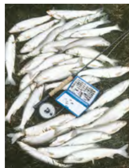
Dagsveiði úr Hlíðarvatni

Um haustið gaf Friðjón Jónsson bóndi mér bambusstöng með snúnum virlykkjum, 14 feta langa eða meira. Stangir þessar voru skornar ofan af stöngum sem íþróttamenn notuðu til stangarstöcks. Hún var alltaf geymd