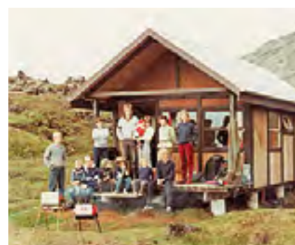
Hluti stórfjölskyldunnar við Ármannahúsið 1982