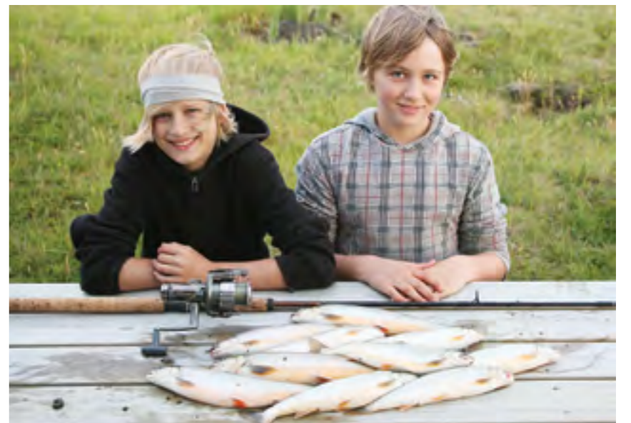
Barnabarnabarn Hjörtur Már og vinur hans með sína fyrstu veiði úr Hlíðarvatni

Við reyndum að koma bændum í skilning um að það væri ekki unnt að auka silungsveiði, fá fólk til að fara í