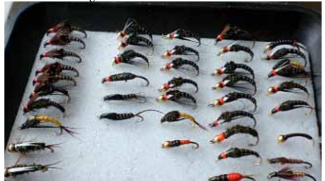
Friskódís er fremst en aftur má sjá Glódísi og aðrar flugur í ýmsum afbrigðum. Á endanum í næstöftustu röð er afbrigði af Watsons fancy með gulu stéli sem mokveiddi á Leirutánni þegar aðrar flugur brugðust.

Eins var með Töfrapúpuna. Þá gaf ég honum hana og hann kallaði hana þetta því hann fékk hátt á annað hundrað fiska á hana í Helluvatni, í Kerinu. En það er eins og ég segi: Það er ekkert sama hver heldur á stönginni. Menn eru bara misveiðirnir.