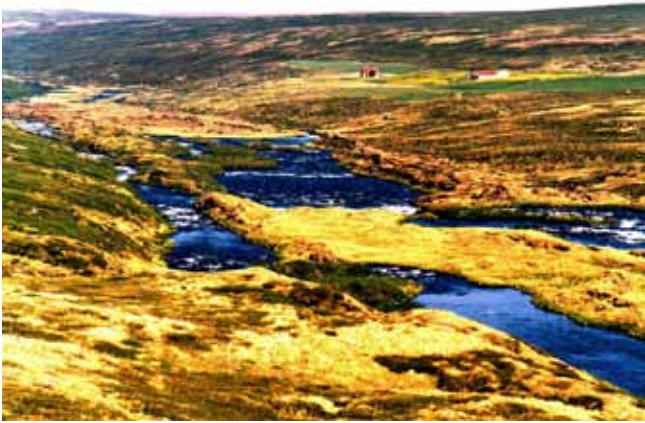
Horft að Hofsstöðum í Mývatnssveit, paradís fluguveiðimannsins.