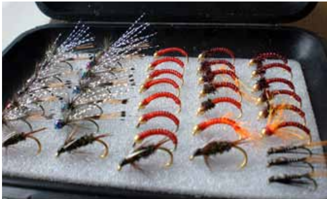
Freddi fremst en Blóðormur fyrir miðju.

Flugurnar sem veiða þurfa nú ekki allar að vera merkilegar. Móbutó er til dæmis bara lítill fluga á beinan öngul nr. 14 eða 12, vinil ribb en með ýmsum tilbrigðum. Stundum set ég hvítt við hausinn eða rauðan tvinna, það er unnt að gera allan fjandann. Það er eins og með Blóðorminn, þar ertu með rauðan tvinna, en ég hnýti hann á gylltan öngul.