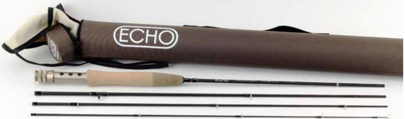
Echo Carbon stöngin er 7,3 fet og fyrir línu 2. Stórkostleg stöng í silungsveiðina á mjög góðu verði.

Veiðibúðin Krafla hefur styrkt Ármenn með gjöfum í happadrætti undanfarin ár og eru Ármenn hvattir til að kíkja við í Veiðibúðinni Kröflu í Höfðabakka 3.