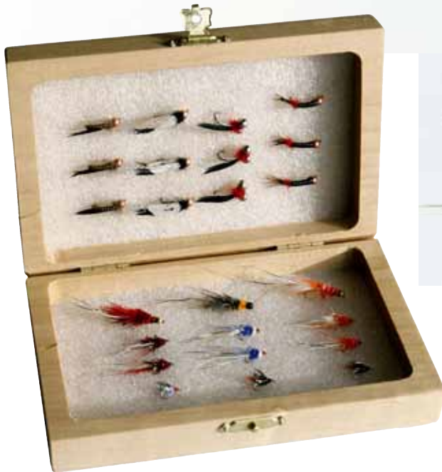
Í Veiðibúðinni Kröflu er hægt að fá íslensk viðarbox með fallegum og gjöfulum silungaflugum. Veiðimenn geta fengið nöfnin sín árituð á boxin.