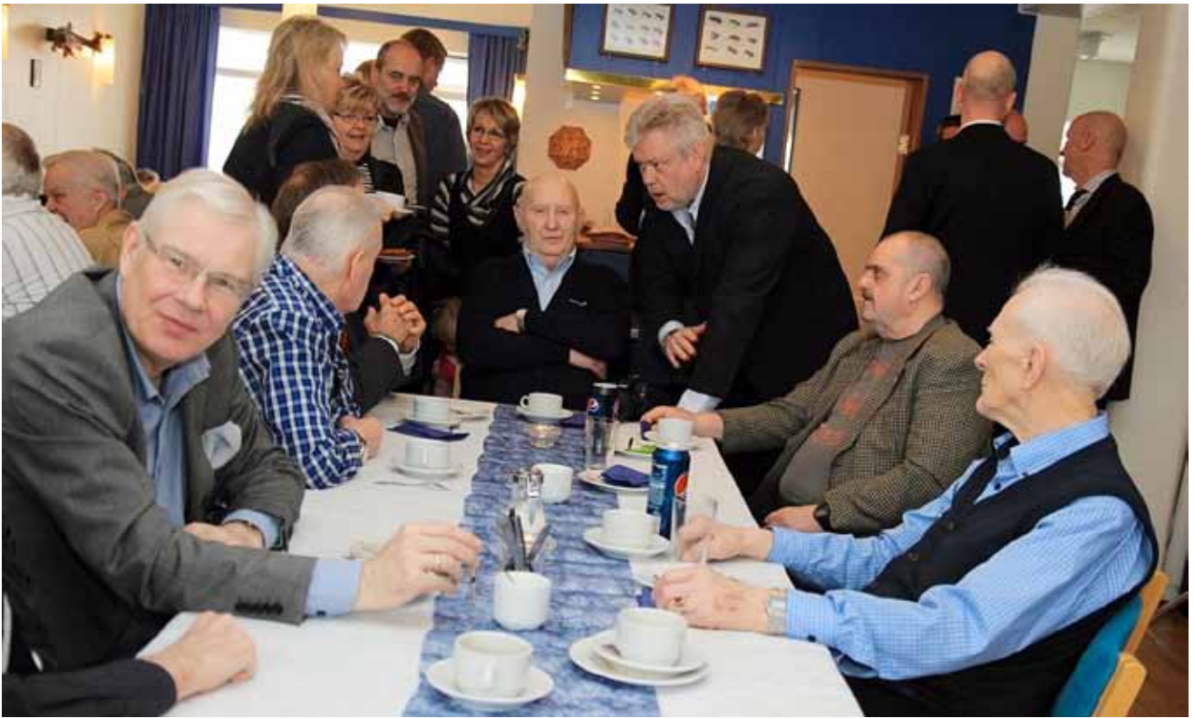
Fullt af fólki í afmælinu