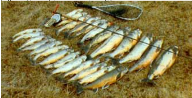
Bingó. Morgunveiði í Þingvallavatni í maí 1980.

Ef við tökum Þingvelli sem dæmi. Þar er ég vanur að byrja eld-snemma, kannski fimm eða sex en ég er yfirleitt hættur um tvö eða þrjú. Það er ekki bara vegna þess að ég er búinn að fá nóg heldur hættir fiskurinn þá að taka. Það getur verið alveg yndislegt að veiða á nóttunni. Þá er iðulega logn og allt kyrrt en svo fer að hverssa þegar hafgolan byrjar um 11-leytið og þá er bara erfitt að veiða.