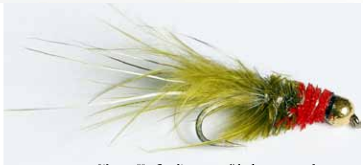
Silunga Krafla olive og rauð hefur reynst vel en SilungaKröflurnar eru til í sjö litum og ýmsum tærðum.