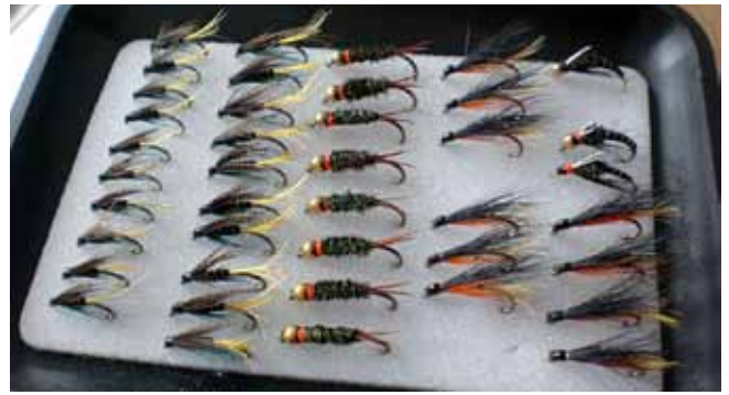
Girnilegur matseðill fyrir Hlíðarvatn.