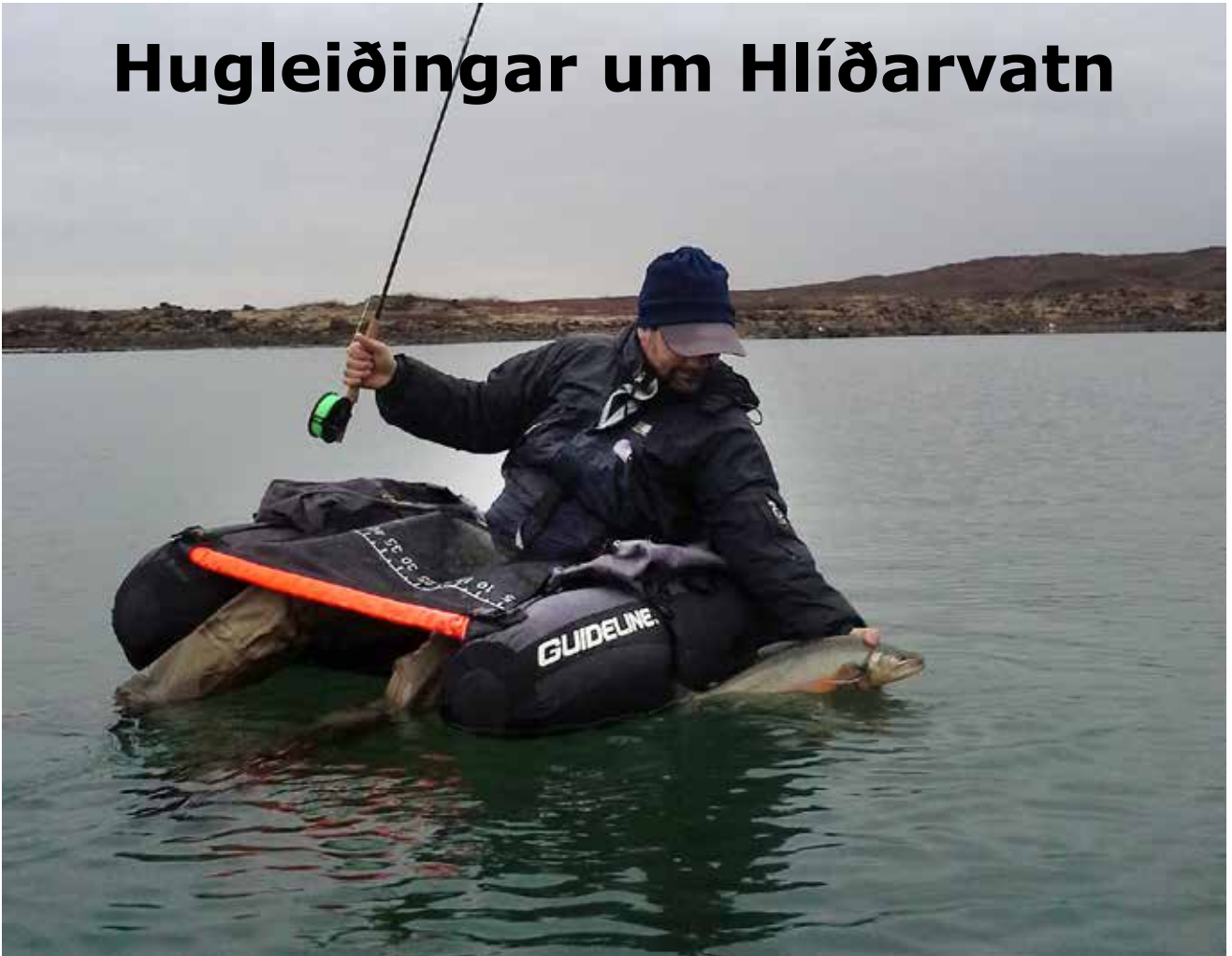
Þeir fiska sem róá....