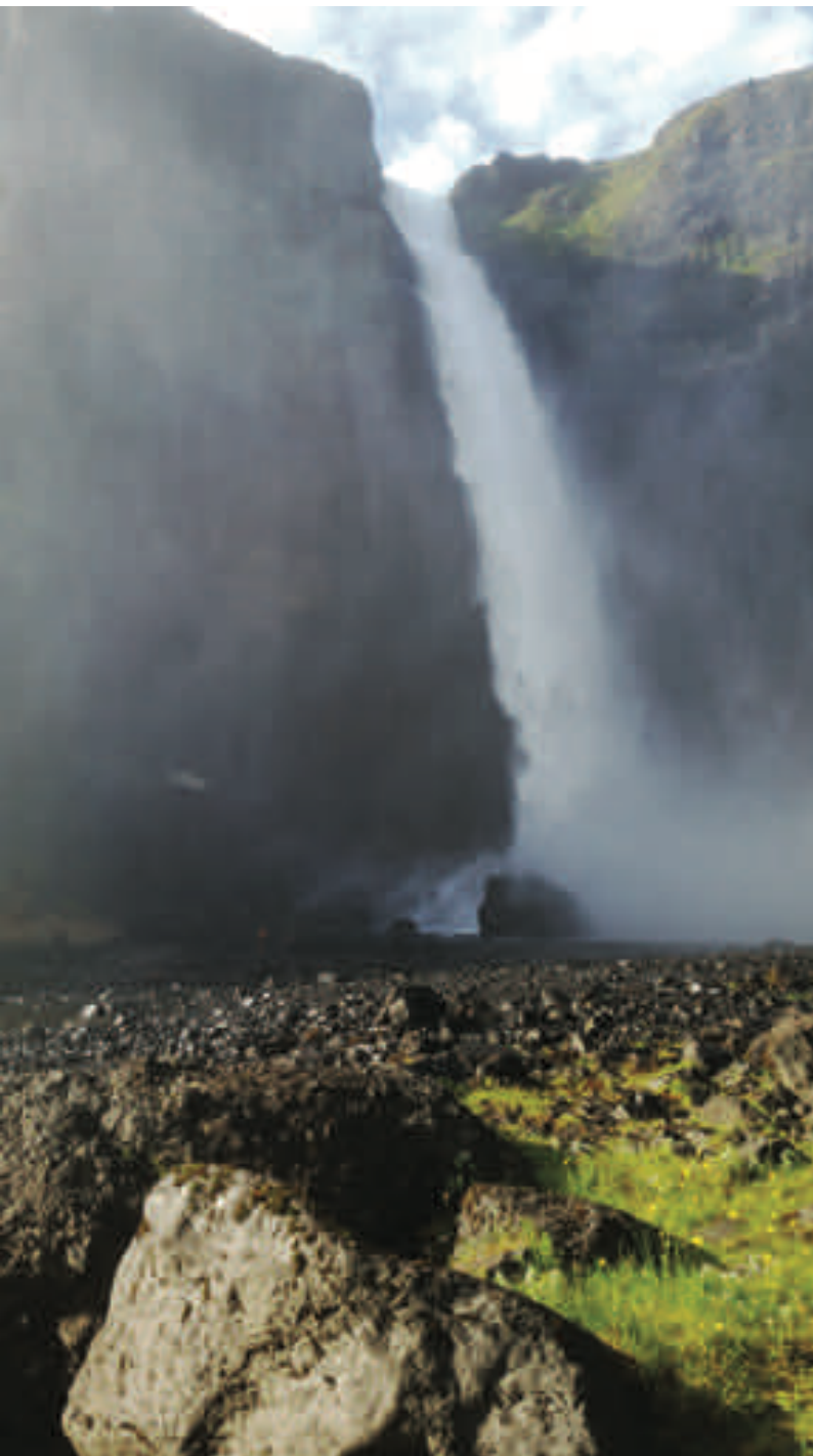
Háifoss, efsti veiðistaður á silungasvæðinu í Fossá. Þriðja myndin: Gilið í Fossá, stórbrotið veiðisvæði.